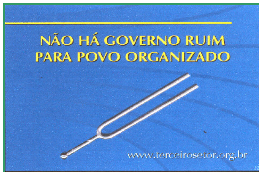
DIAPASÃO – SÍMBOLO DA REBRAF

Durante o exercício houve também a contribuição de 30 entidades do Conselho Gestor e Fiscal, e doação em espécie da ACSP - Associação Comercial de São Paulo, disponibilizando valores variados totalizando uma arrecadação mensal em torno de R$ 7.000,00.